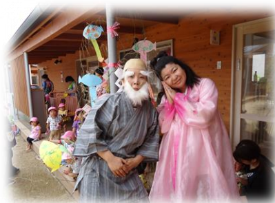
七夕祭りに天の神様と織姫来たる!!